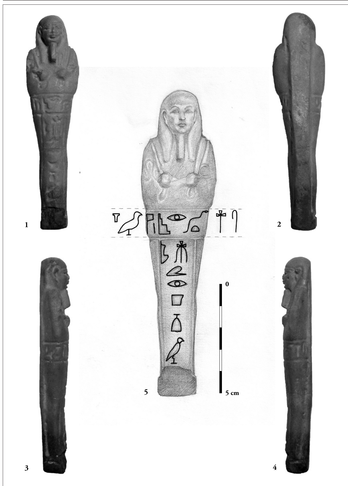
Planșa 1 Ushabti (Nr. Inv. 4633): 1. Vedere din față; 2. Vedere din spate; 3. Vedere din stânga; 4. Vedere din dreapta; 5. Desenul statuetei cu inscripția hieroglifică desfășurată