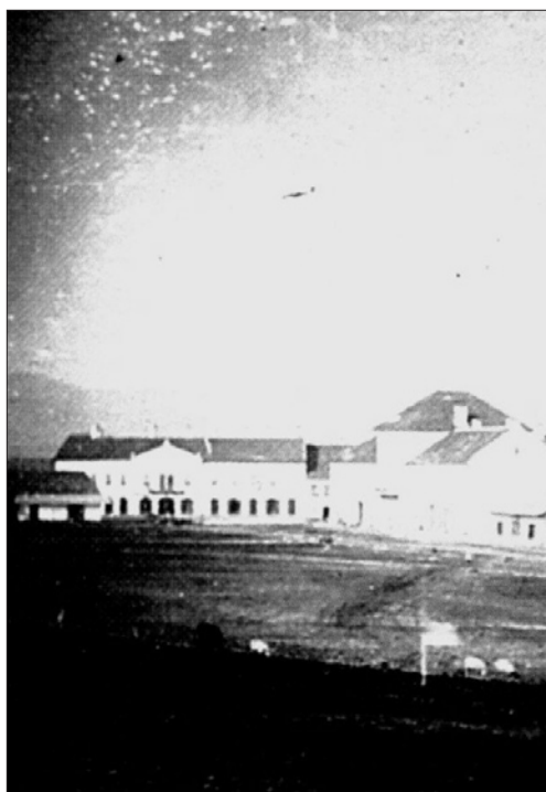
3. ábra Az 1835-ben alapított első Kaszinó épülete Orbán Balázs 1860-as évekbeli fényképén (a részlet bal szélén) és az 1856-ban alakult Kaszinónak az emeleten helyet adó mai színház (a részlet jobb szélén)