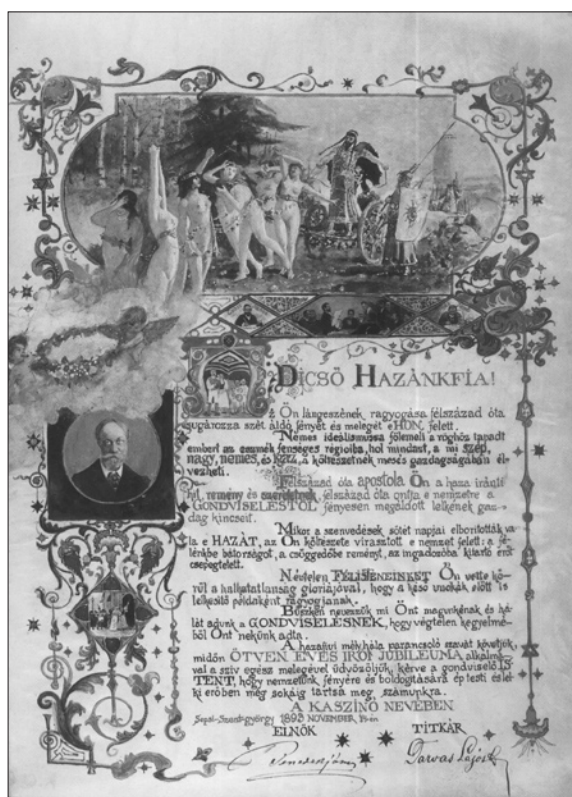
4. ábra A Jókai Mórt 1893–1894-ben felköszöntő díszalbum (Gyárfás Jenő, részlet)