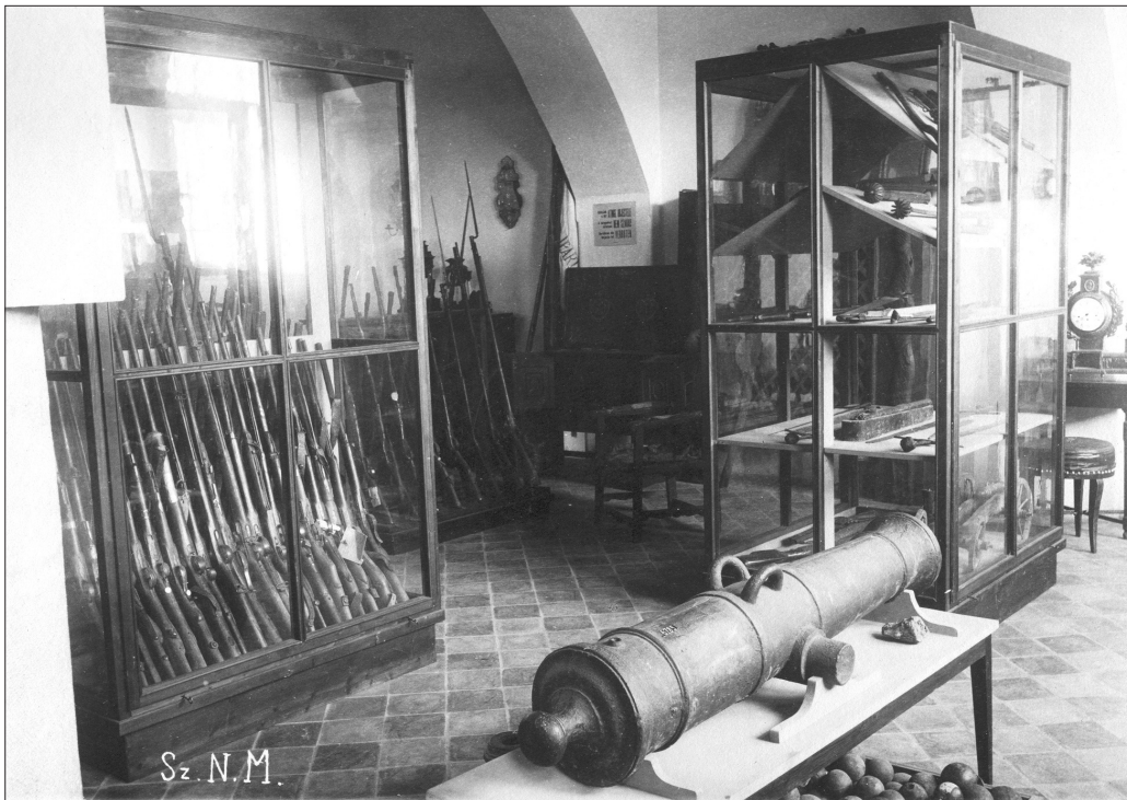
2. kép A két világháború közötti időszakban, a Székely Nemzeti Múzeumban