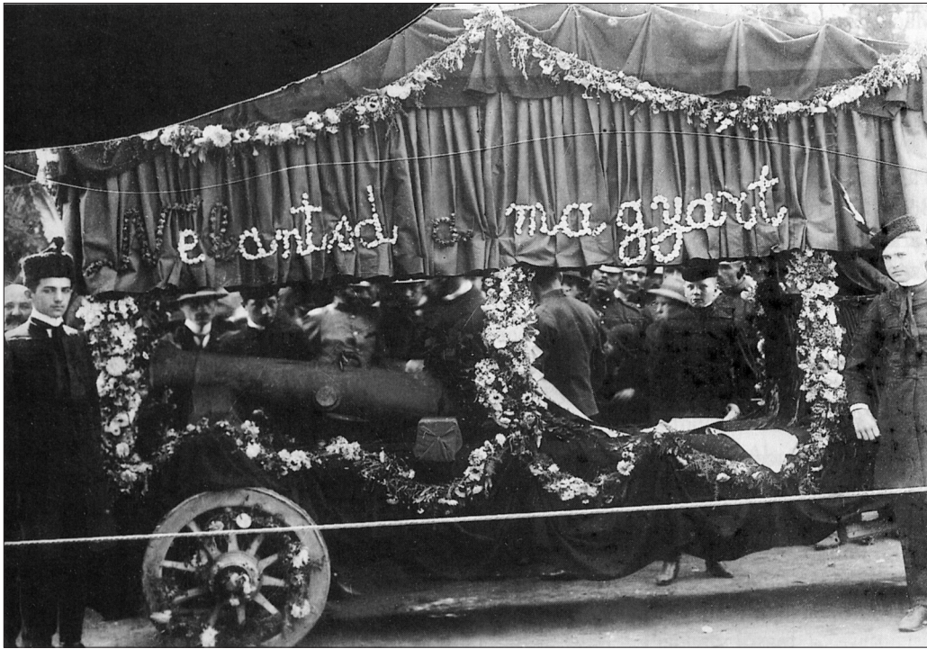
1. kép Az ágyú 1906 augusztusában, Kézdivásárhelyen