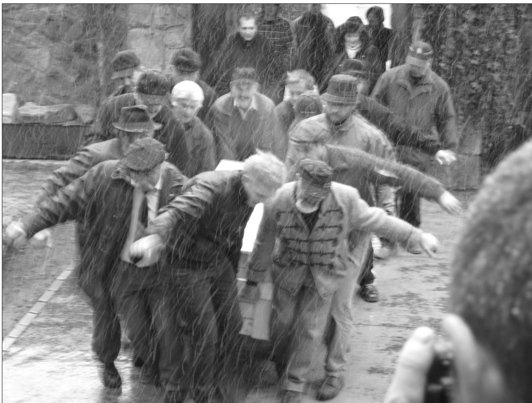
5. kép 2010 márciusa: az ágyú hazatér