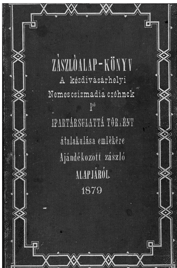
5. sz. fotó A zászlóalap-könyv előlapja. (ILCM-Tört., A.I.120.)