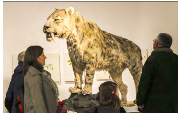
Kardfogú tigris a Jégkorszak kiállításon