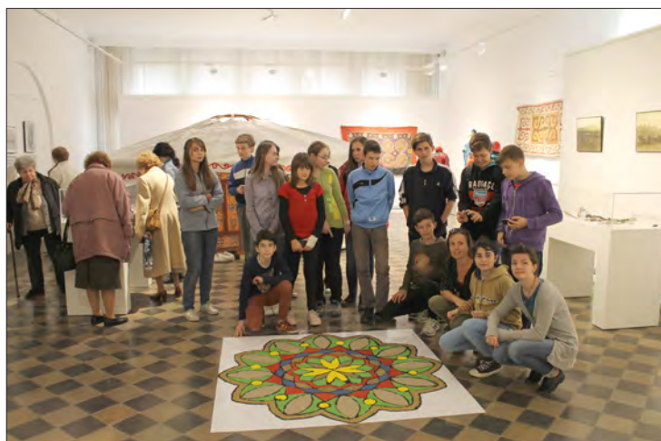
Mandalakészítés a Dzsingisz kán öröksége kiállításon