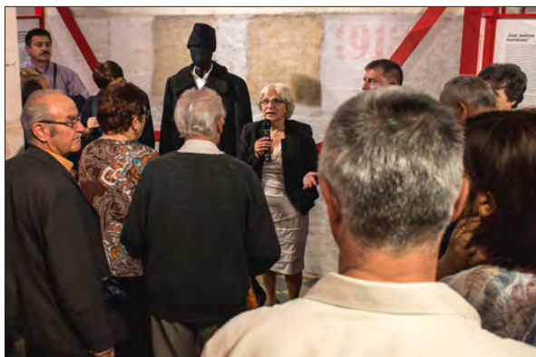
Vernisajul expoziției „Mesaje de pe front”

În aprilie 2017 a avut loc vernisajul expoziției dedicată etnografului Gábor Szinte, organizat de Muzeul de Etnografie din Budapesta.