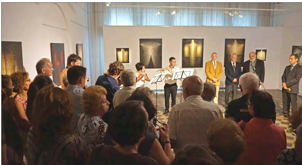
A Vinczeffy 70. kiállításunk megnyitója

A Magma Kortárs Kiállítótér számos kiállítása és műhelyfoglalkozása közül megemlíthető a 2016-ban szervezett Brâncuși fiai és lányai kiállítás, amelyről a rangos The New York Times is cikkezett, vagy a netWorks című kiállítás, amelyben közreműködött Barabási Albert-László hálózatkutató is.