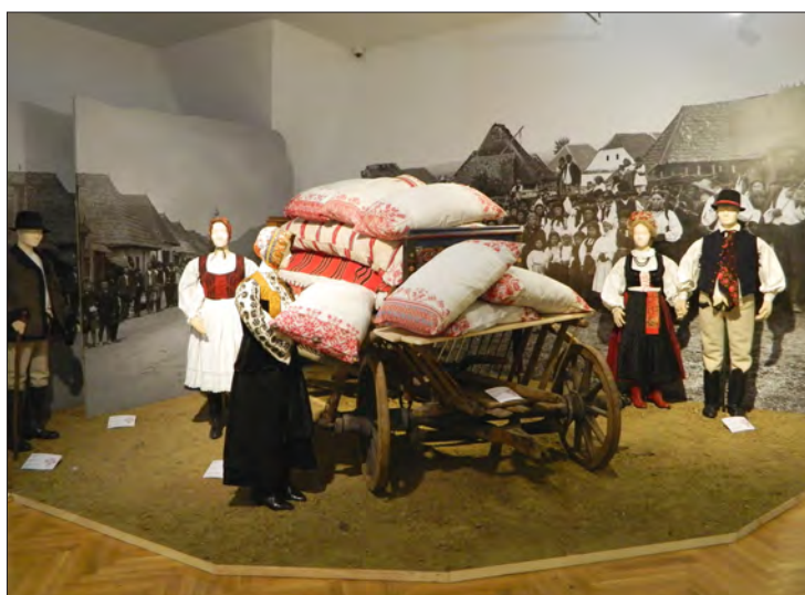
A megújult néprajzi alapkiállítás