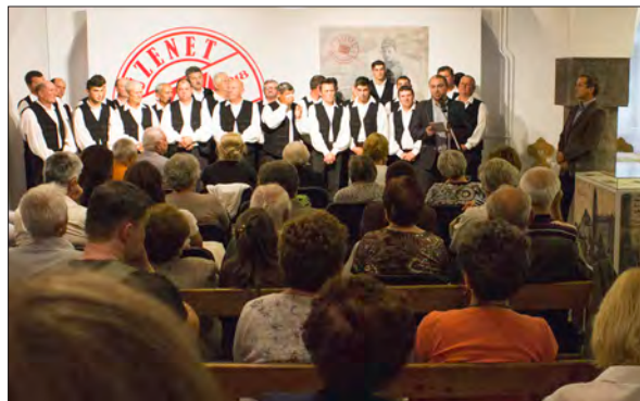
Könyvbemutató az Üzenet a frontról kiállítás megnyitóján

Bízunk benne, hogy beszámolóinkat olvasva, az évkönyvet lapozgatva, tanulmányozva felkeltjük a kedves Olvasó érdeklődését az intézményünkben folyó tudományos, közművelődési és művészeti alkotómunka iránt.