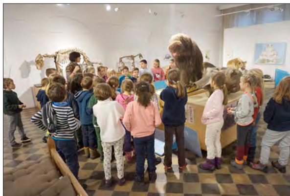
Múzeumpedagógiai foglalkozás a Jégkorszak kiállításon