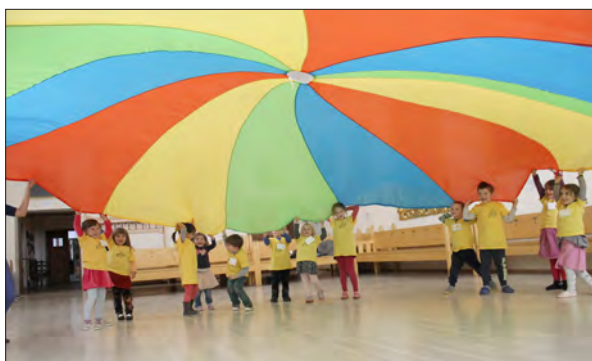
Activitate în cadrul proiectului „Meleté”