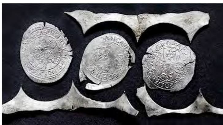
Numizmatikai lelet az uzoni Béldi–Mikes-kastélyból