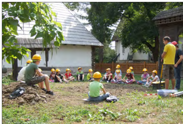
Régészhet a Székely Nemzeti Múzeumban

A kézdivásárhelyi Incze László Céhtörténelmi Múzeum a palócok mindennapjait bemutató kiállítást nyitott ( Kocsira ládám, hegyibe párnám... Ácsolt és festett ládák a Palócföldről ), illetve két kiállítással is megemlékezett a Reformáció ünnepéről ( A Vizsolyi Biblia 425 éve, Reformáció 500 ).