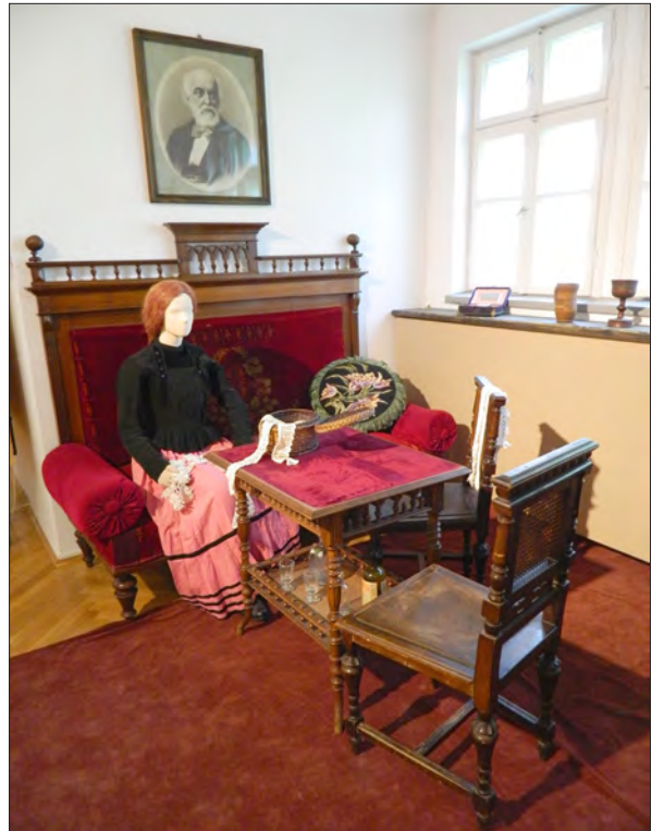
A megújult néprajzi alapkiállítás