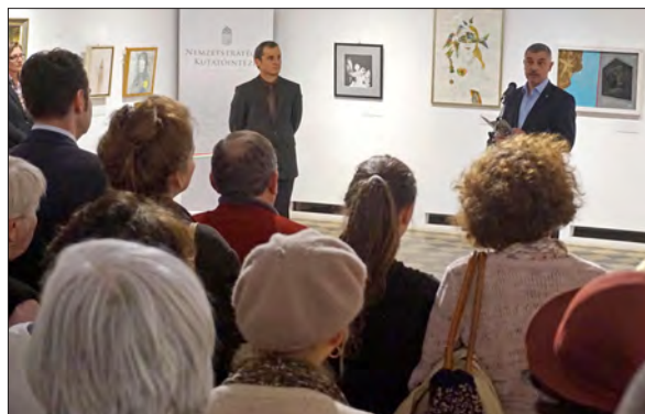
Vernisajul expoziției „Boldogasszony”

Muzeul Național Secuiesc este o instituție regională, a cărei activitate este subvenționată de către Consiliul Județean Covasna. Funcționează cu o bibliotecă, cu secțiile de științele naturii, de arheologie și istorie, de etnografie, respectiv cu unități externe, cum ar fi cea de arte plastice din Sfântu Gheorghe (Galeriile de Artă „Gyárfás Jenő”, Centrul de Artă Contemporană „Magma”), cea din Baraolt (Muzeul Depresiunii Baraolt), cea din Cernat (Muzeul „Haszmann Pál”), cea din Târgu Secuiesc (Muzeul de Istorie a Breslelor „Incze László”) și cea din Zăbala (Muzeul Etnografic Ceangăiesc). Asigurarea funcționării Centrului Artistic Transilvănean a fost preluată de către Primăria Sfântu Gheorghe.