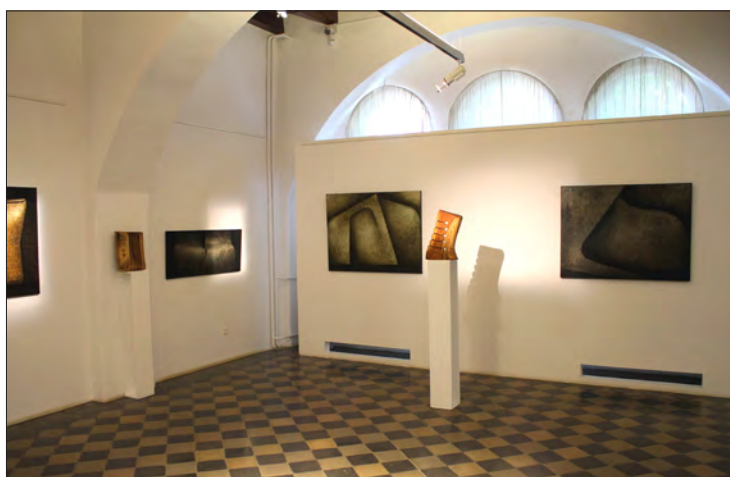
Expoziția de artă plastică „Vinczeffy 70”