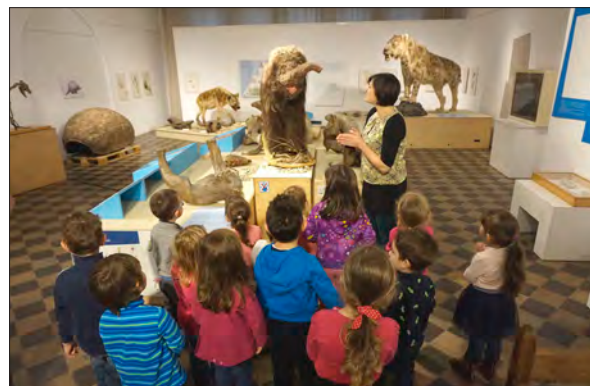
Activitate de pedagogie muzeală în expoziția „Era glaciară”