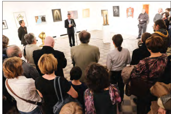
A Boldogasszony kiállítás megnyitója