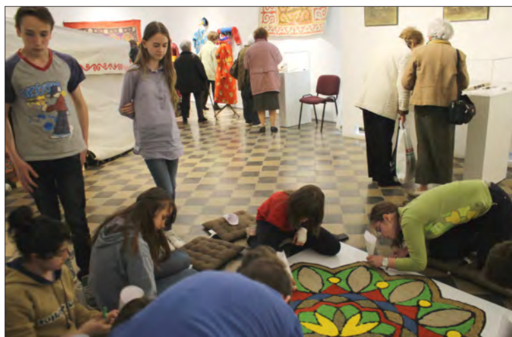
Crearea unei mandala