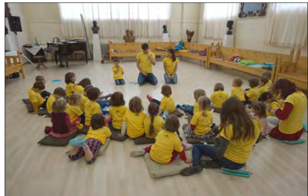
Zenepedagógiai foglalkozás a múzeumban