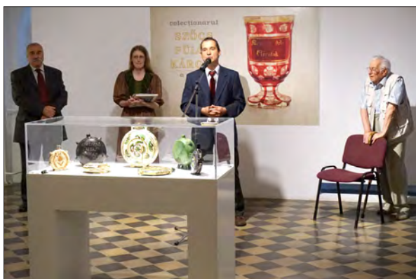
A Szócs Fülöp Károly gyűjteményéből készült kiállítás megnyitóján