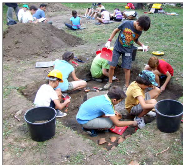
„Săptămâna arheologilor” în Muzeul Național Secuiesc

Muzeul de Istorie a Breslelor din Târgu Secuiesc a organizat conferințe despre Reformație și istoria orașului Târgu Secuiesc, iar Muzeul Etnografic Ceangăiesc a organizat Seminarul Tinerilor Etnografici și Taberele de dansuri și cântece populare .