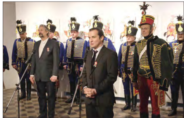
A Száz magyar lovas című kiállítás megnyitóján