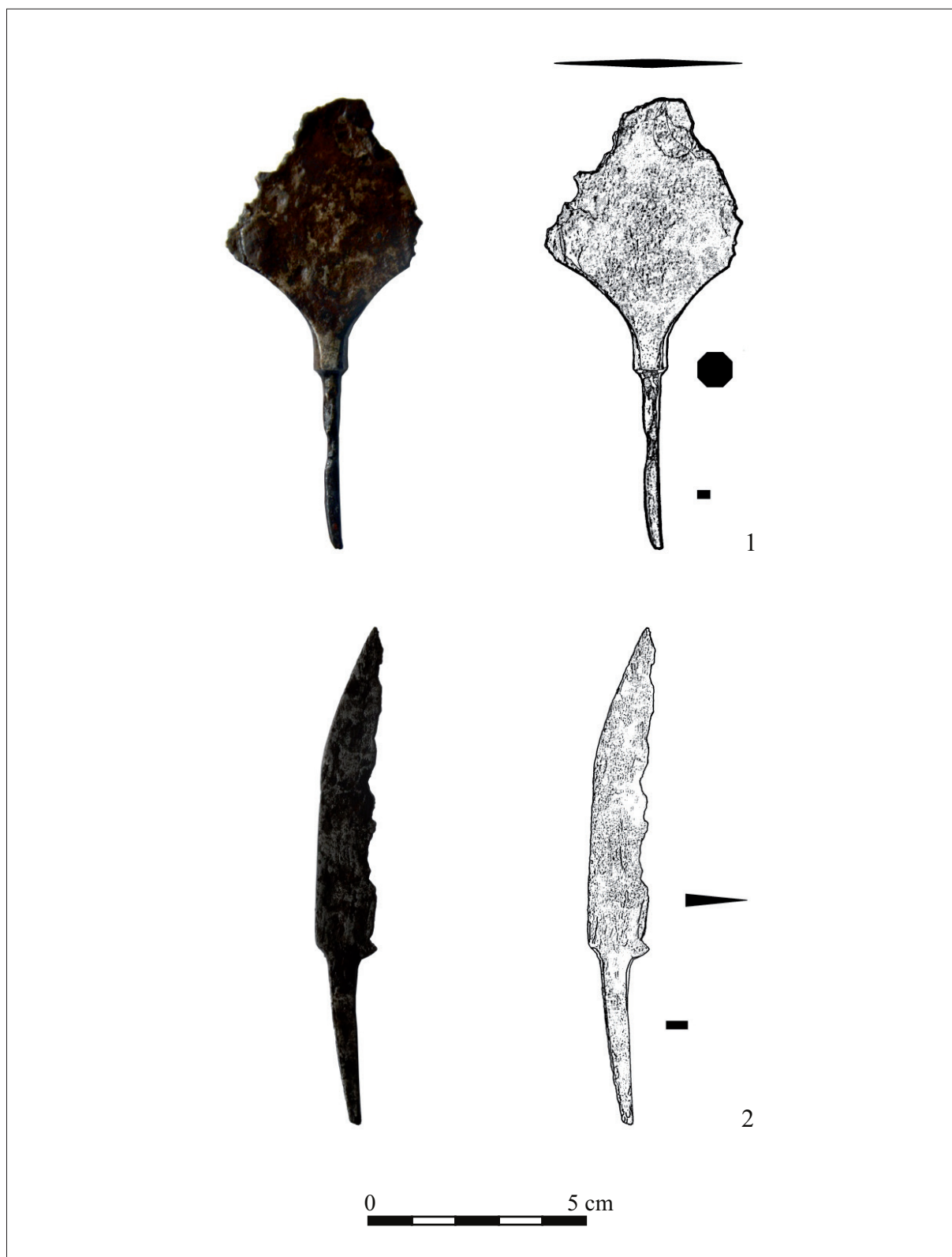
2. tábla Szárhegy-Nagy Csaba kertje. 1. A rombusz alakú, ütközős nyílhegy; 2. A kés