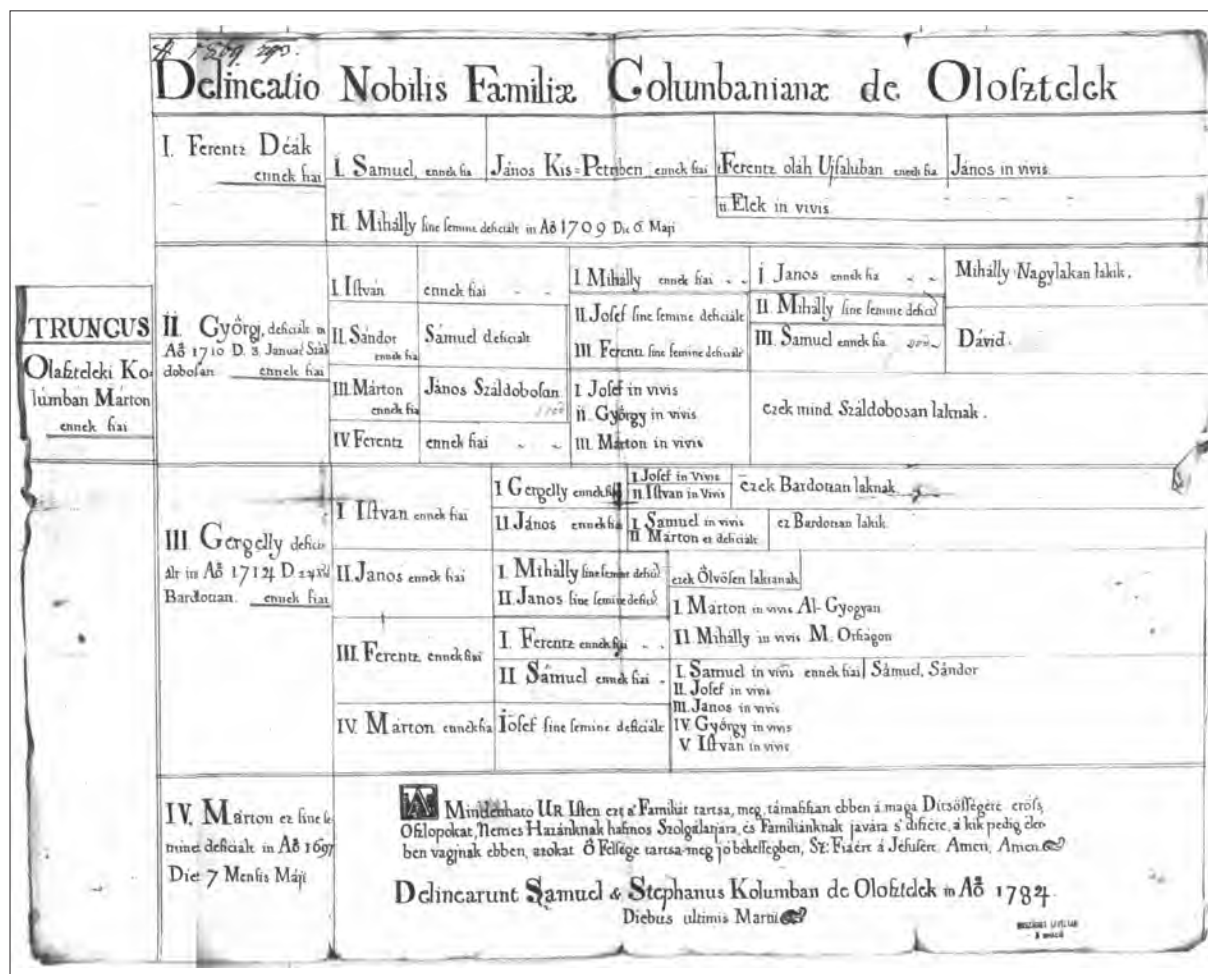
5. ábra Az első Kolombán-productionalisokat követően, 1784-ben összeállított Kolombán-családfa (Magyar Nemzeti Levéltár Országos Levéltára: MNL OL, B 2–1847–6429, acclusák ad 1869/1793, F melléklet – a 37070. számú mikrofilmről)