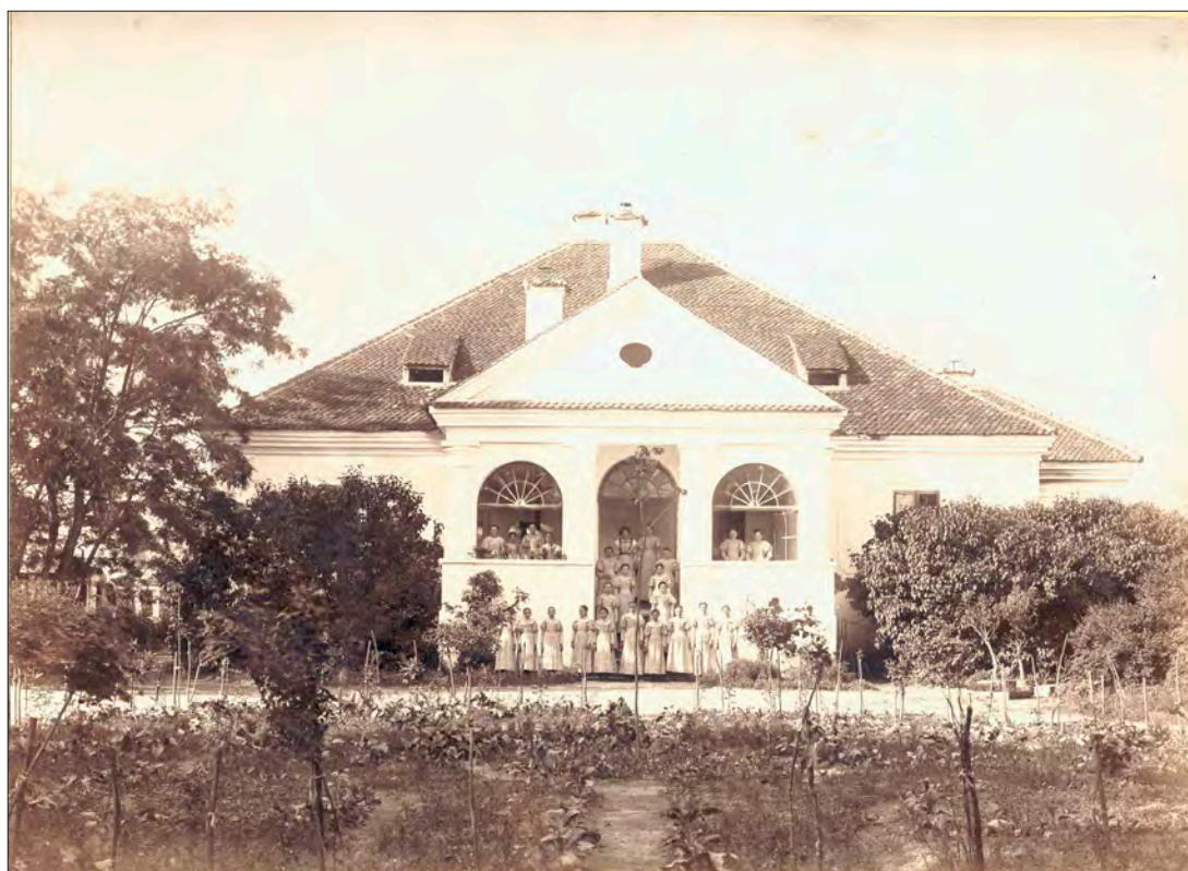
A Daczó-kúria, a sepsiszentgyörgyi Női pariskola székhelye, 1899. Gere István felvétele. Székely Nemzeti Múzeum fototékája, F. 582-es katalógusszám