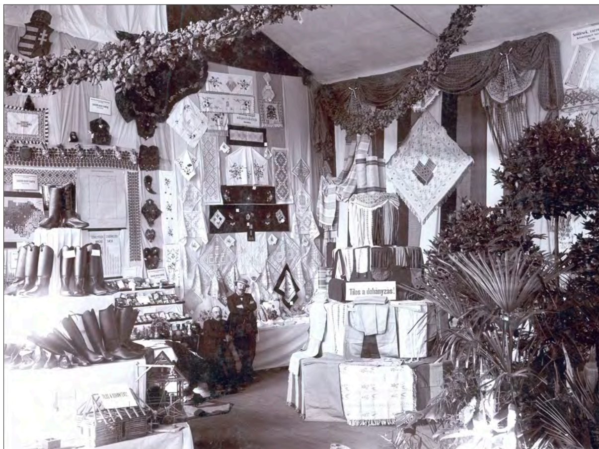
A sepsiszentgyörgyi Nőiipariskola az 1905-ös sepsiszentgyörgyi Székely Kiállításon. F. 135-ös katalógusszám