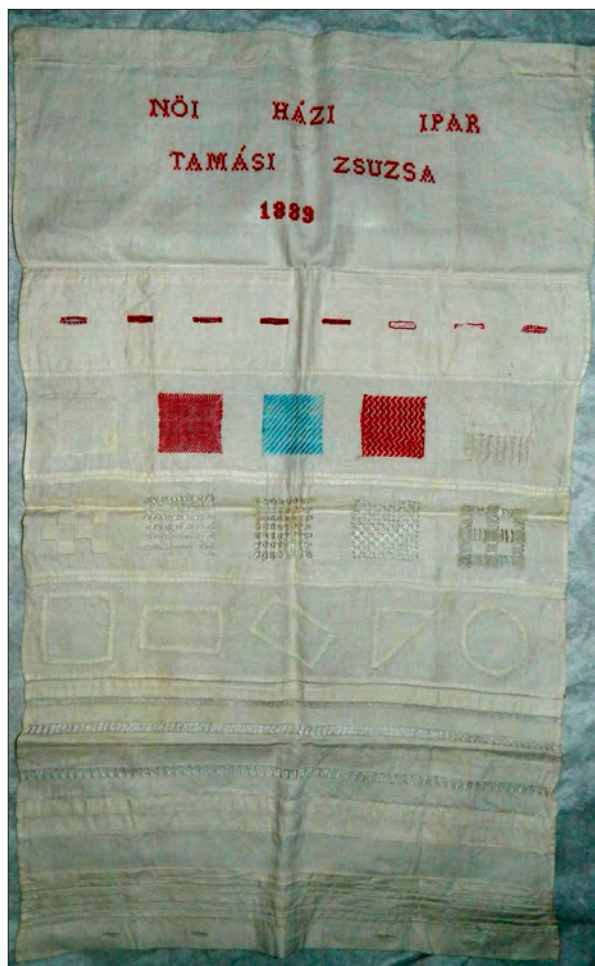
A sepsiszentgyörgyi Nőiipariskolában készített mintakendő. Székely Nemzeti Múzeum tulajdona