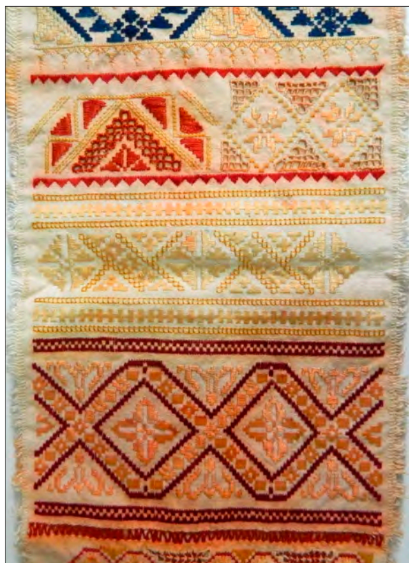
Kalotaszegi vagdalásos minták az előbbi mintakendőről