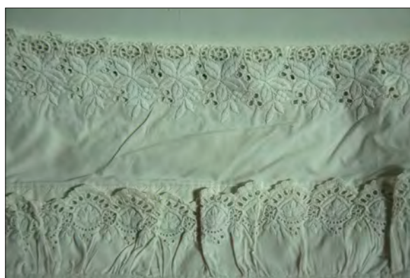
Féherhímezéses párnahuzat részlete. A Női pariskola oktatásának hatására terjedt el Háromszéken a féherhímezés. Kézdialmás, 2017