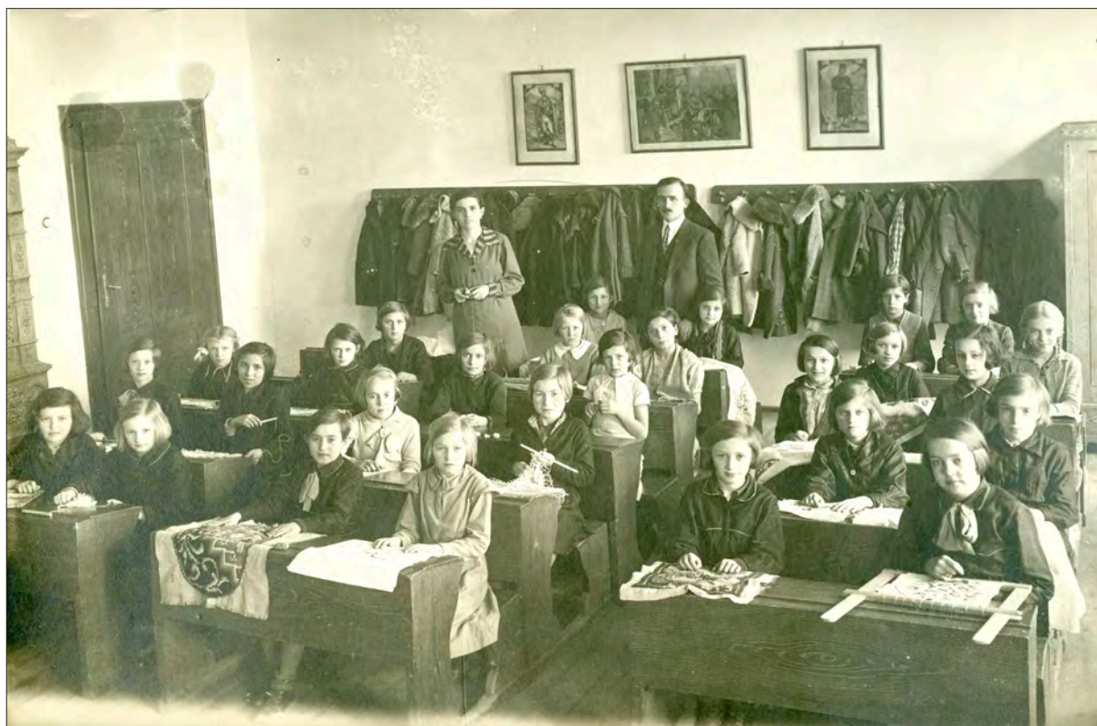
Kézimunkaoktatás, 20. század eleje.