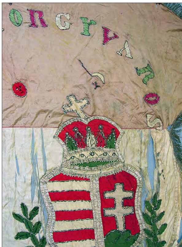
Sepsiszentgyörgy város 1848-as nemzetőrségi zászlaja