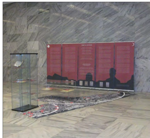
A Cantio Iucunda kiállítás Budapesten

Miután (2018. október 9-én) kiállításra került dísztermünkben Sepsiszentgyörgyön is a potsdami Kelet-Európai Német Kulturális Fórum, a nagyszebeni Friedrich Teutsch Ház és a Brassói Honterus Á. H. Evangélikus Egyházközség Levéltára közös vándorkiállítás, A reformáció Európa keleti részén erdélyi modulja, a következő négy hónapban az SZNM Erdély