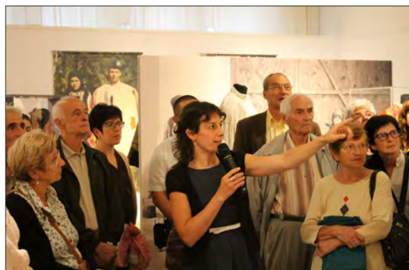
Încoace de Transilvania – dincolo de Câmpia Tisei. Maghiarii din zona Crișului Negru la cumpăna dintre veacuri