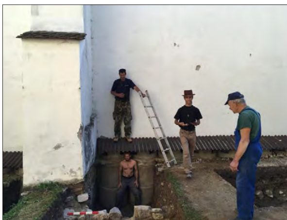
Sepsiszentgyörgyi Vártemplom, ásatás