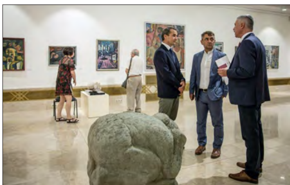
The Panteon exhibition at Budapest

The Székely National Museum is a cultural and scientific institution of regional interest in Romania, financed by the Covasna County Council (Kovászna Megye Tanácsa). At present, it is comprised of four internal sections in Sepsiszentgyörgy (Sf. Gheorghe) – namely, the sections of natural history, archaeology-history and ethnography together with the library which constitutes a section of its own –, and six external units – the Museum of Erdővidék in Barót (Baraolt), the Haszmann Pál Museum in Csernáton (Cernat), the Museum of Guilds' History in Kézdivásárhely (Tg. Secuiesc), the Csángó Ethnographical Museum in Zăbala, the MAGMA Contemporary Art Space and