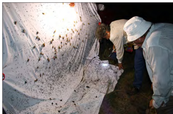
Culegere nocturnă (Cetatea Histria, 21 iunie 2019)