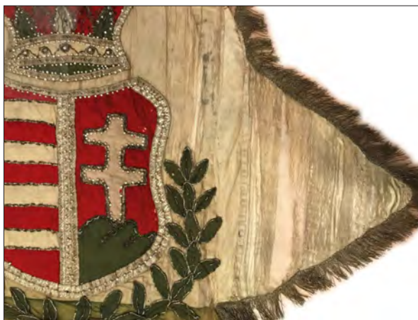
Steagul gărzilor naționale pașoptiste ale orașului Sfântu Gheorghe, detaliu înainte și după restaurare