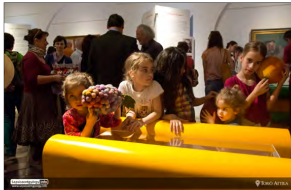
Dicționarul pus în mișcare

În perioada discutată, în Spațiul Expozițional MAGMA au avut loc circa 40 de manifestări artistice. Am evidențiat câteva: netWorks @ K'Arte & UAP Gallery (5 noiembrie 2017) a prezentat opere și proiecte bazate pe rețele – a fost deschisă de cercetătorul celebru al domeniului, Albert-László Barabási (USA). Proiectul interdisciplinar și interactiv Soundweaving , al lui Zsannett Szirmay, a interpretat cu melodii unele motive vizuale împrumutate din broderia populară (15 aprilie 2018). Artiștii participanți la expoziția Între poli (7 mai 2018) au reflectat la problematica polarizării excesive. Prima expoziție din România cu opere originale ale lui Daniel Spoerri ( A digera trecutul – Eat Art și Object Art , 16 august 2018) s-a concentrat pe întruparea arheologiei culturale, fiind urmată de un banchet organizat între operele expuse, unde cina a fost consumată după un schimb general de bucate (1 octombrie 2018). METALURGICA Martin Zet, expoziție de Mona Vatamanu & Florin Tudor (6 martie 2019), a interpretat conceptul muncii și al producției materiale,