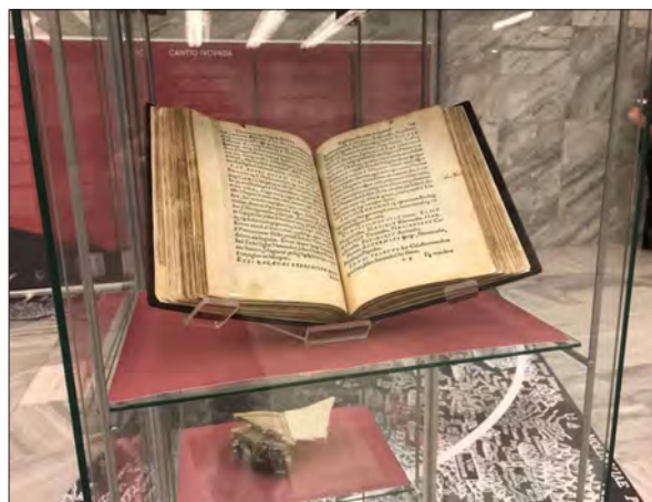
Expoziția Cantio Iucunda la Budapesta

După primirea în sala noastră festivă din sediu, la 9 octombrie 2018, a expoziției itinerante Reforma în partea de est a Europei, modulul Transilvania și Părțile , realizată de Forul Cultural German din Europa de