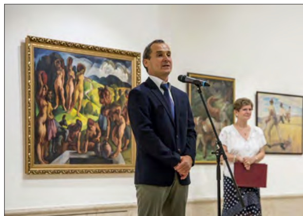
A Panteon Budapesten

2008 óta következetesen azon dolgozik, hogy a térségben kortárs művészeti eseményeket szervezzenek, azon belül is a médiaművészetre fektetve a nagyobb hangsúlyt. Egyéni és csoportos kiállítások szervezésén kívül más művészeti projekteket is kezdeményez: szakmai előadások, beszélgetések, viták, filmvetítések, műhelyfoglalkozások helyszínéül szolgál, és online, valamint hagyományos kiadványok létrehozását is vállalja.