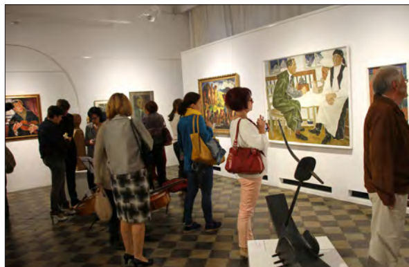
Expoziția Panteon la Sfântu Gheorghe

În mai-iulie 2019, expoziția Panteon a putut fi vizitată la Miercurea-Ciuc, în Muzeul Secuiesc al Ciucului. Am expus 85 opere de artă, în primul rând cele reprezentând curentele progresiste din Transilvania.