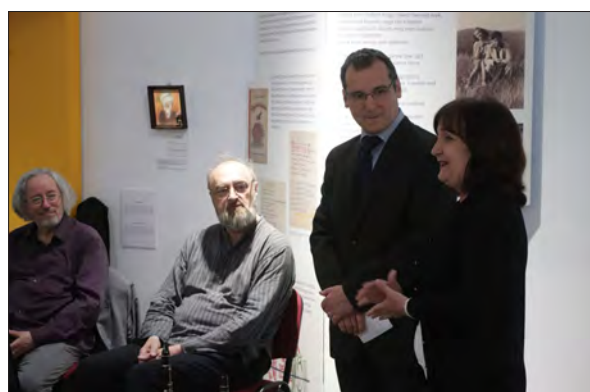
A megmozdult szótár