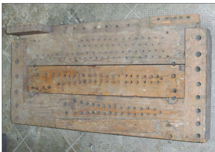
5. ábra A síptőkék felülnézetből