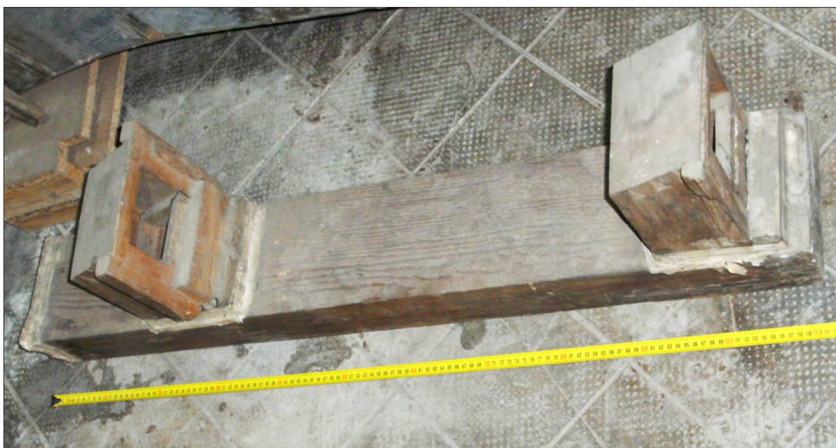
13. ábra A fűvókhoz csatlakozó szélcsatorna