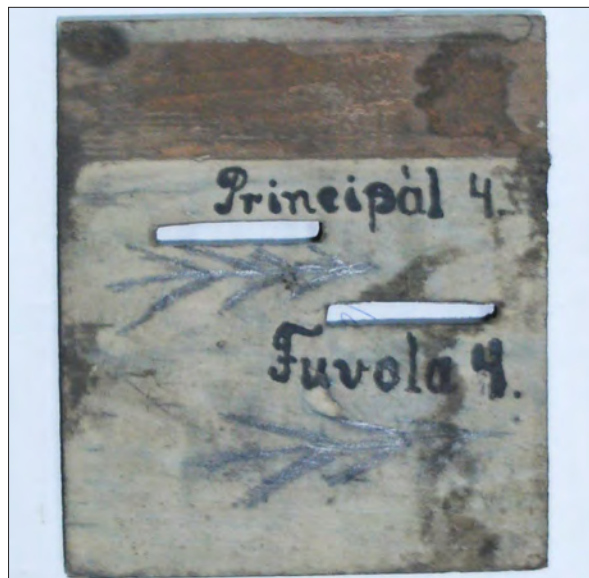
4. ábra Két regiszterkapcsoló pálca felirata