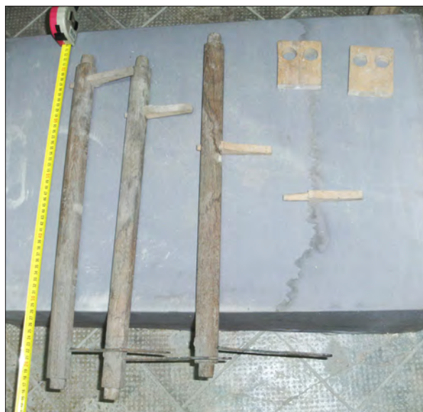
3. ábra Csúszkahúzó tengelyek karokkal, regiszterhúzó pálcákkal, tengelyágyakkal