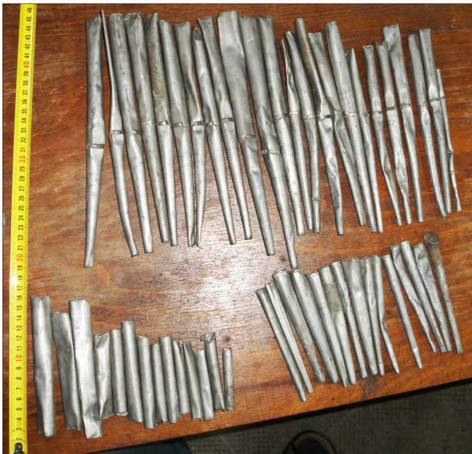
11. ábra A benti fémcsipók maradványai