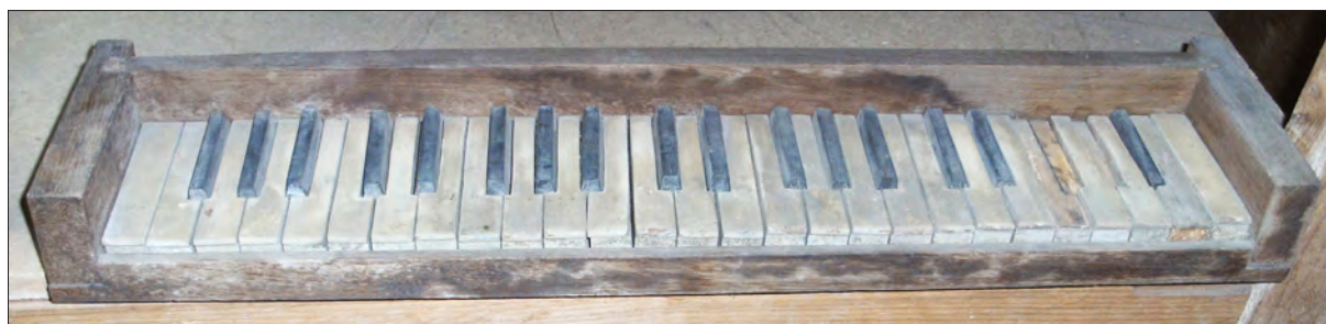
8. ábra A billentyűzet