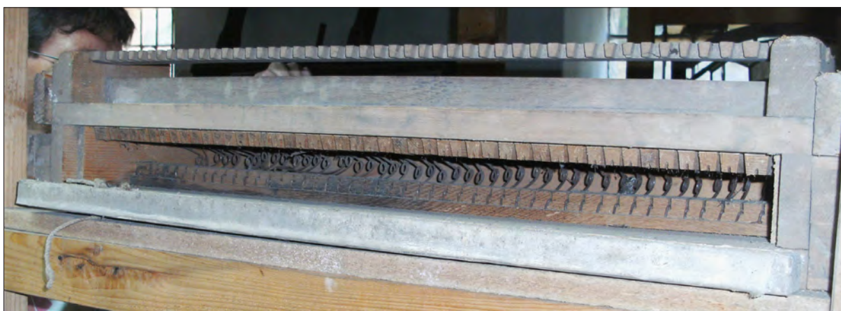
2. ábra A szelláda szelepszekrénye