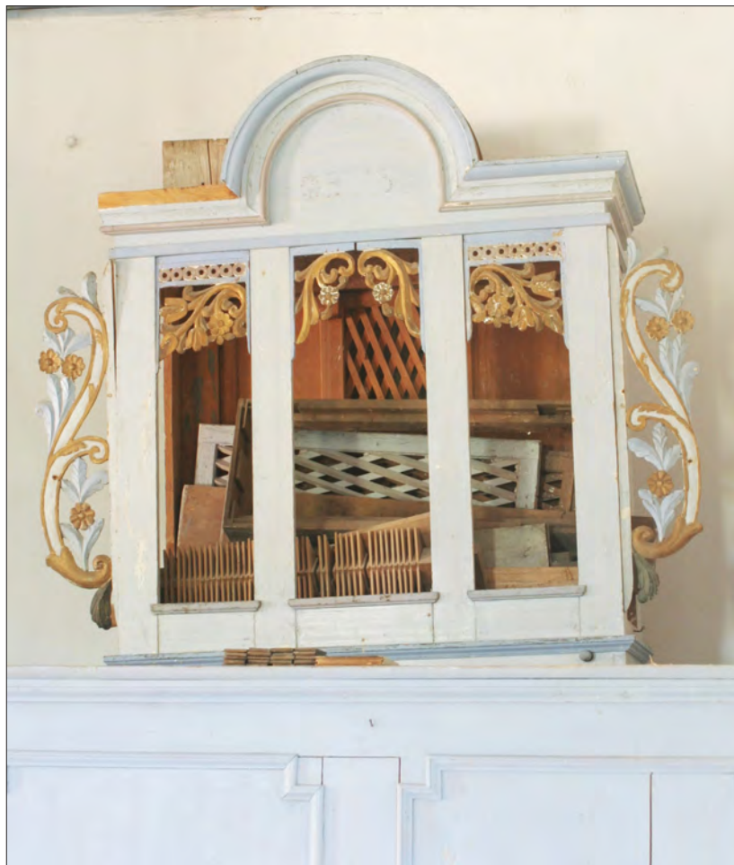
15. ábra Kede, unitárius templom, Balázs Mózes eredetileg hátuljátszós, négyregiszteres, romos hangszere (1853)