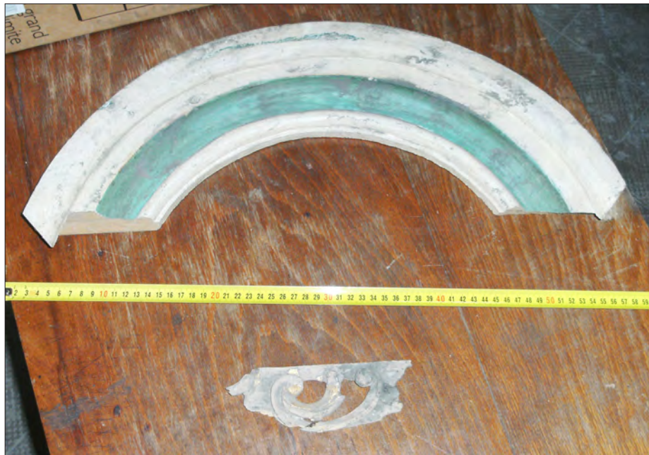
14. ábra Két faragványtöredék