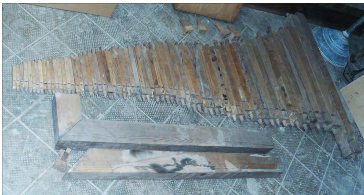
9. ábra A fasípok