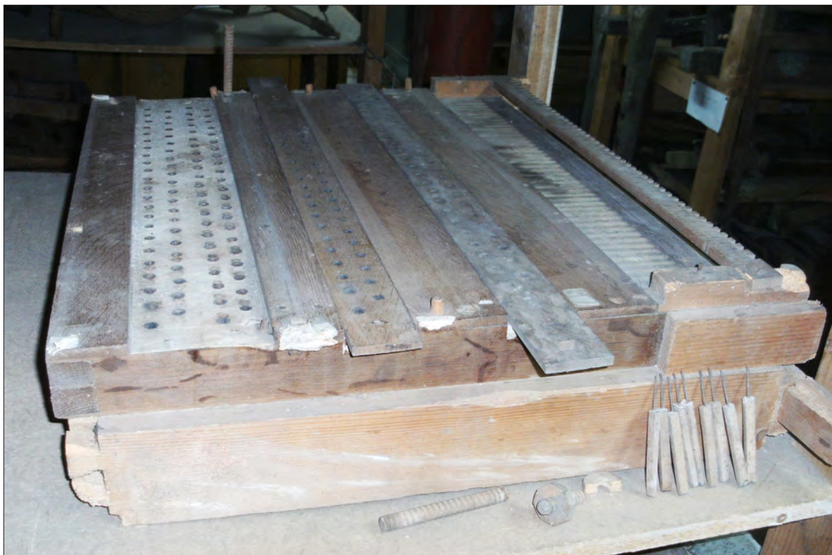
1. ábra A szelláda két csúszkával, előtérben tolópálcákkal és tőkecsavarokkal