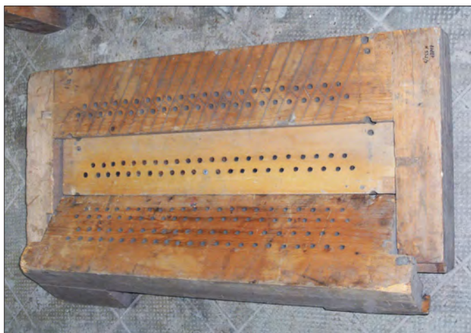
6. ábra A síptőkék alulnézetből