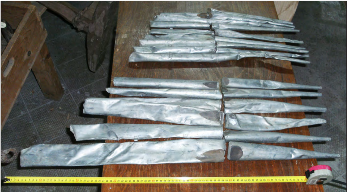
10. ábra A homlokzati fémcsipók (principál 2')