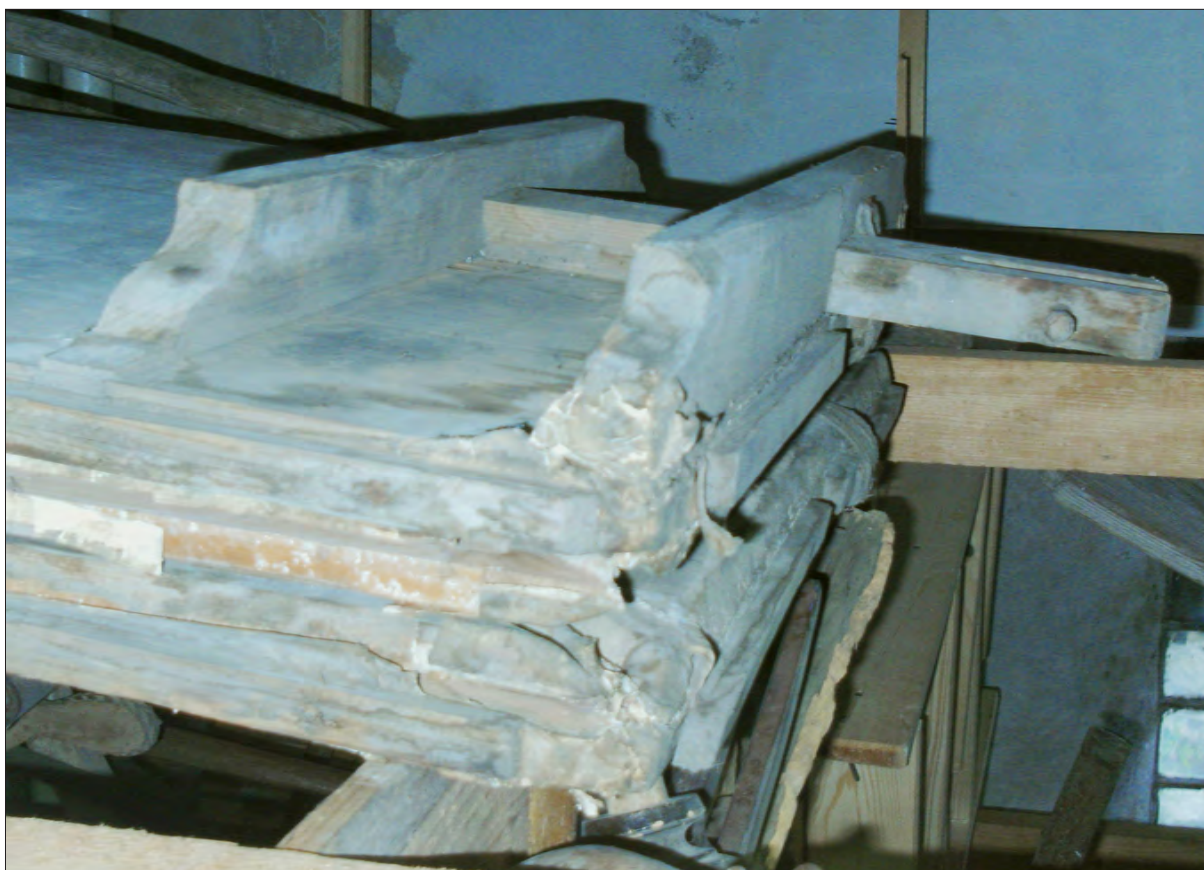
12. ábra Az egyik fűvó mozgó vége a merevítővel és a nyomórúd csatlakozásával