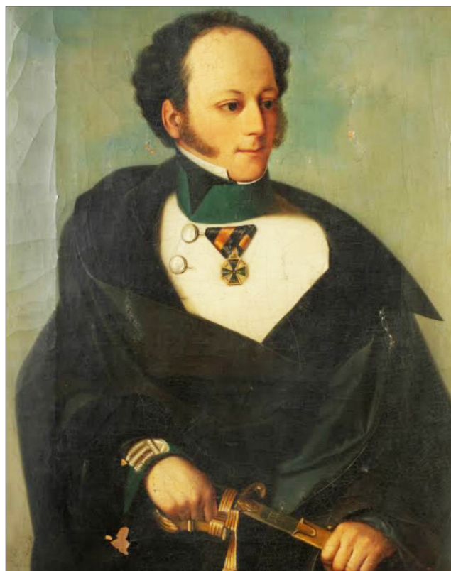
3. ábra Maderspach Ferenc (1793–1849)