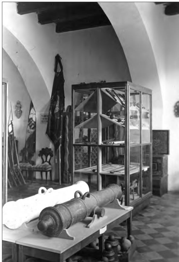
10. kép Azonosítatlan címeres forradalmi lobogó (bal oldalt) a múzeum két világháború közötti kiállításán (SzNM, F. 399)