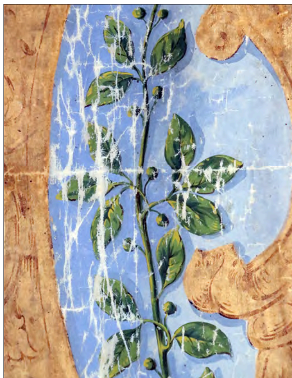
6. kép Töredezések a címerdíszt övező olajágon (részlet)