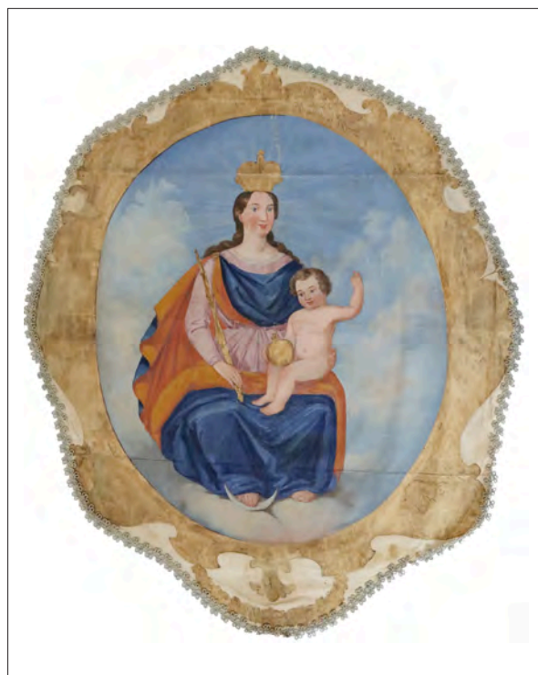
2. kép Magyarország Nagyasszonyának ábrázolása a 86. honvédszászlóalj lobogójának címerdíszen