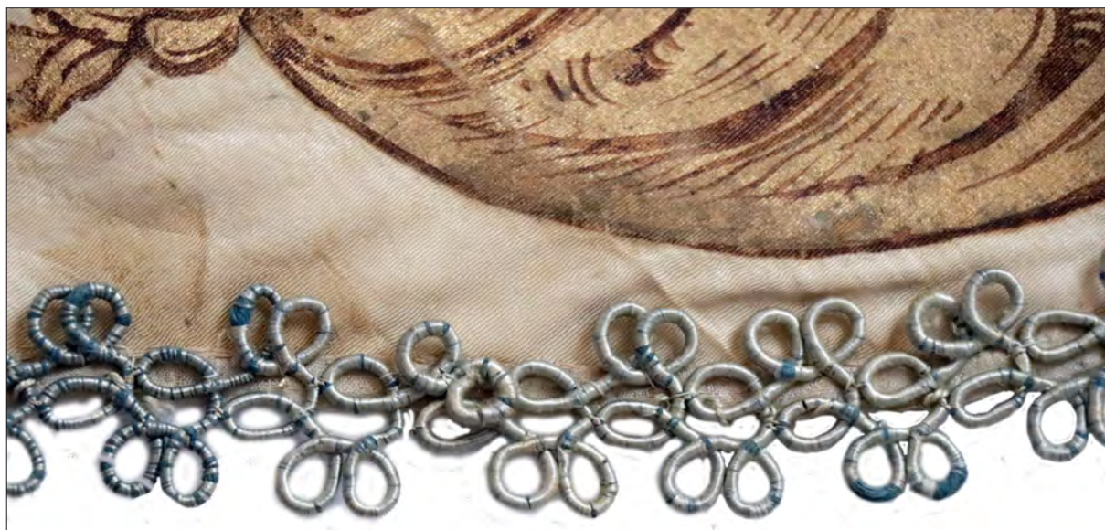
3. kép A címerdíszet övező csipkepszomány (részlet)