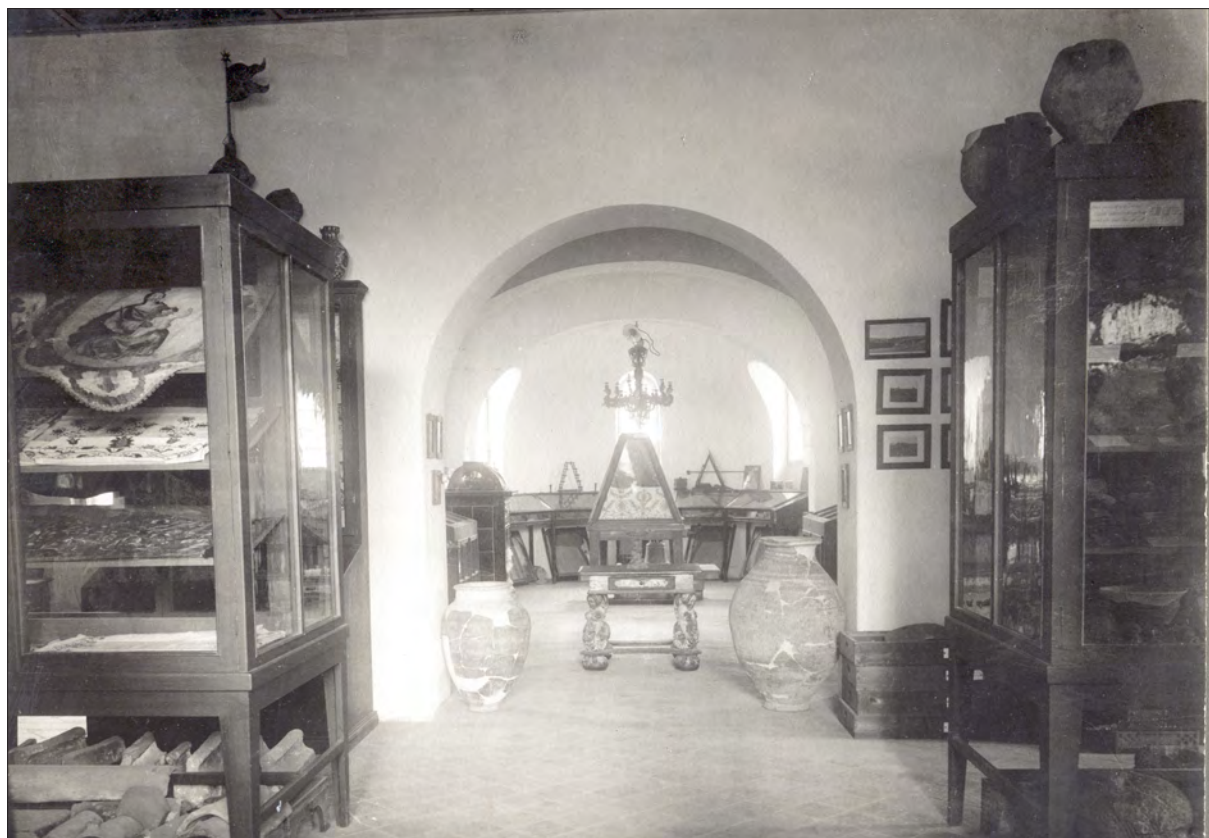
9. kép A madonnás címerdíszt (balra fent) a múzeum két világháború közötti kiállításán (SzNM, F. 447)