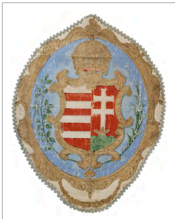
1. kép Koronás országcímér a 86. honvédszászlóalj lobogójának címerdíszen