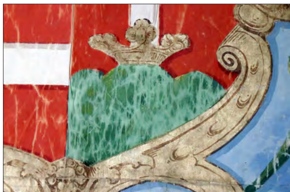
7. kép Rongálódás a hármashalom felületén