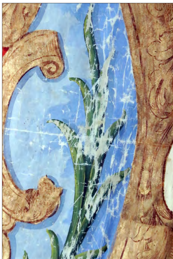
5. kép Töredezések a címerdíszt övező babérágon (részlet)