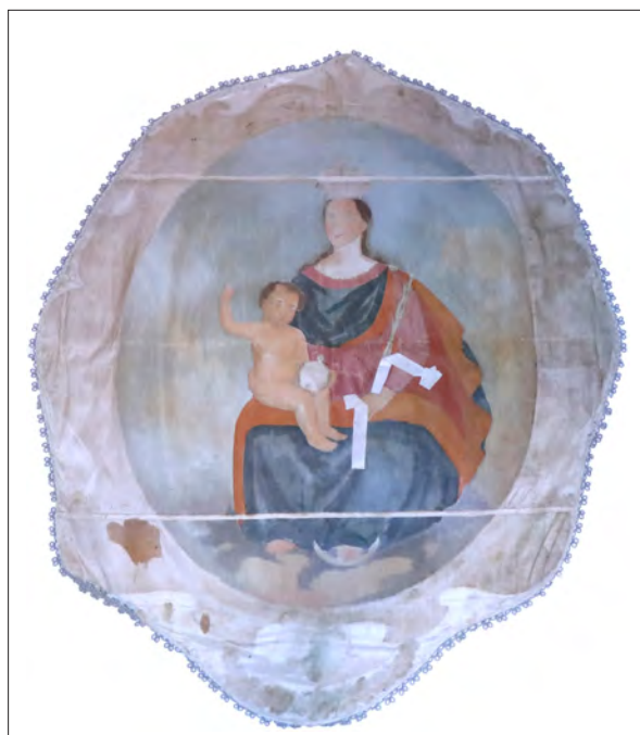
8. kép Javítások a madonnás címerdíszt hátdalán