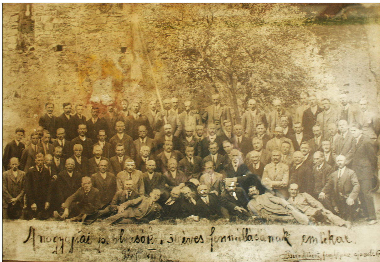
1. ábra A nagyajtai polgári olvasókör csoportképe a 30 éves jubileumról