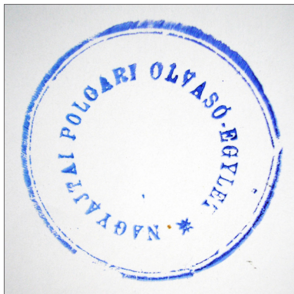
4. ábra A Nagyajtai Polgári Olvasó-Egylet első világháború előtti pecsétnyomata