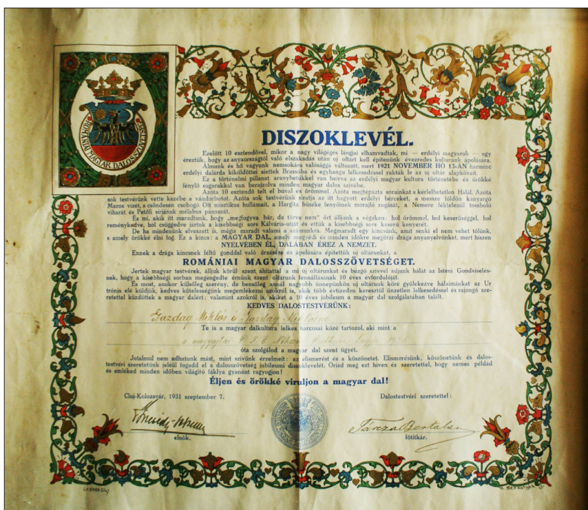
2. ábra A Romániai Magyar Dalosszövetség Keöpeczi Sebestyén József tervezte 1931-es diplomája a nagyajtai intelligencia két illusztris tagjának