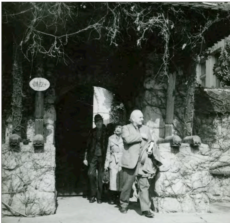
10. ábra László Gyula 1973-as látogatása a Székely Nemzeti Múzeumban