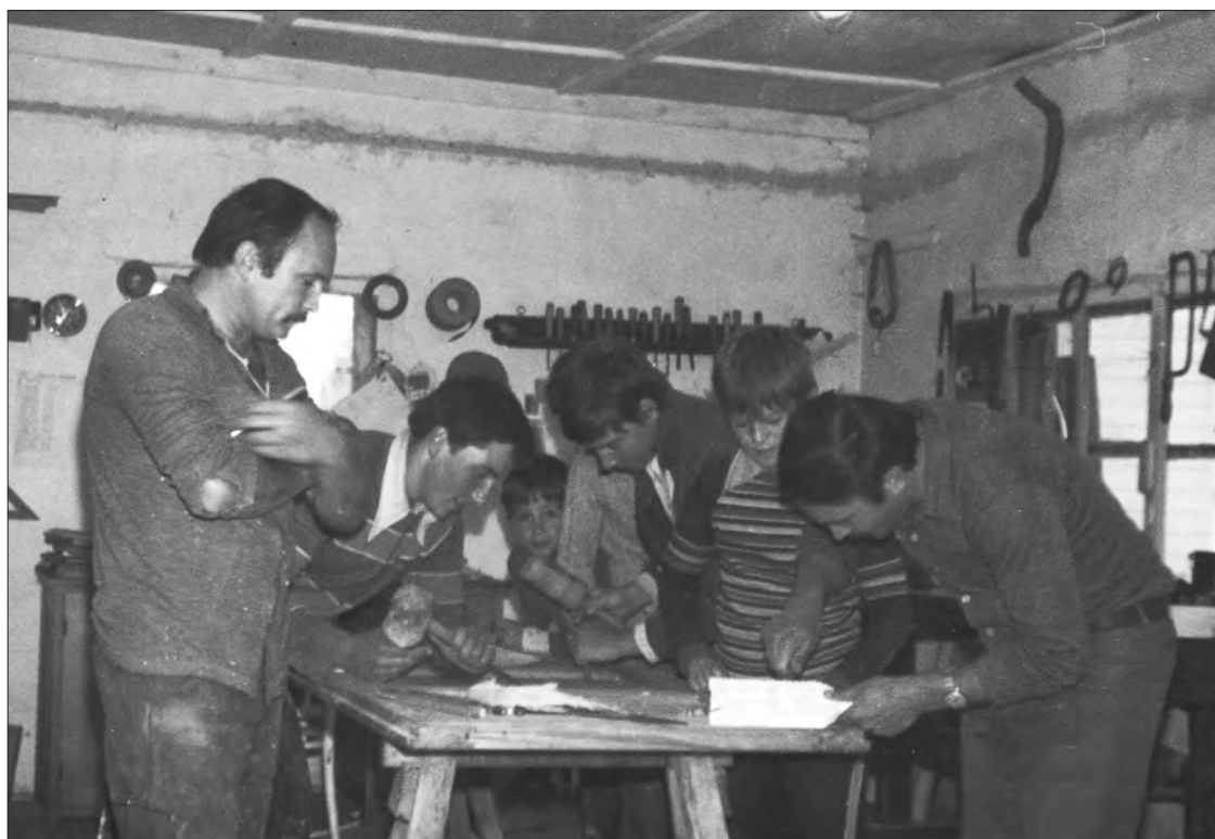
4. ábra A múzeum mellett a kezdetektől működött a faragóiskola