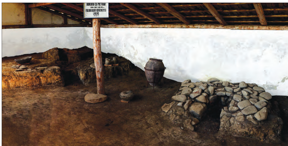
8. ábra A 8–9. századra datált, földbe ásott, kő tűzhelyes lakás in situ látható a múzeumban