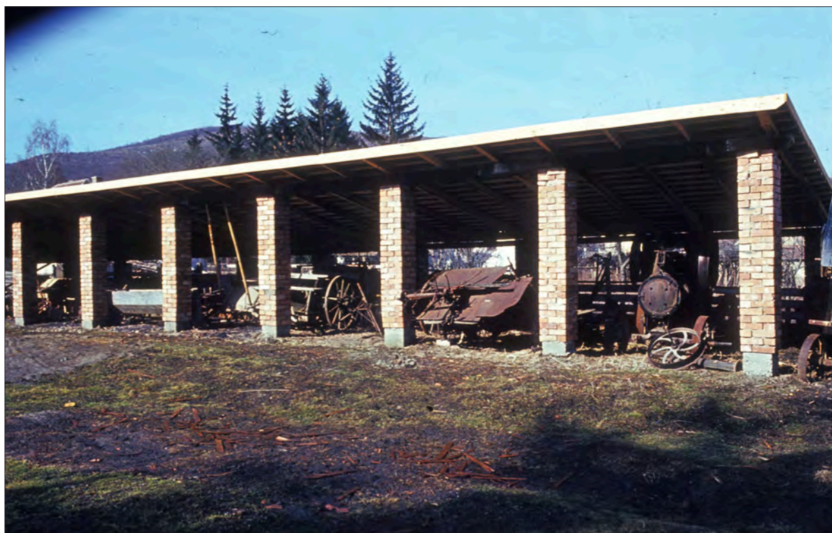
2. ábra 1974-ben megépült az első gépszín