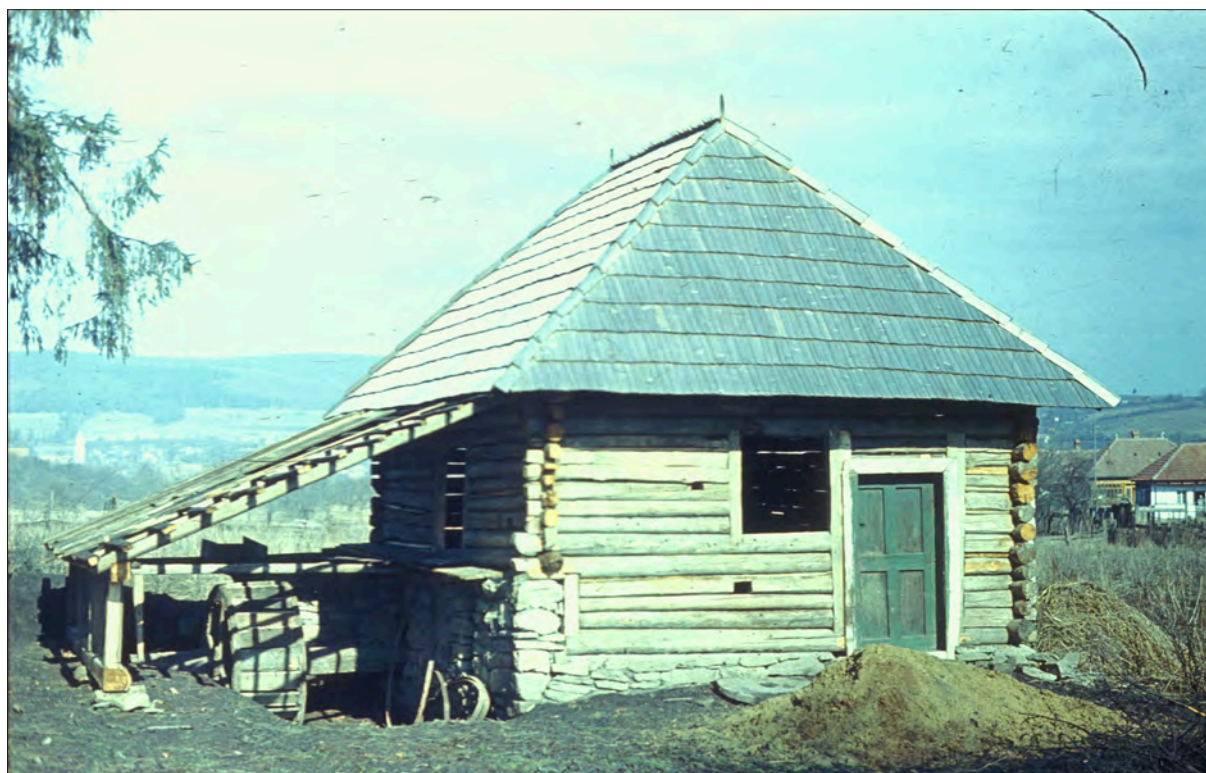
6. ábra Az Orosz Simon-féle kétköves vízimalom