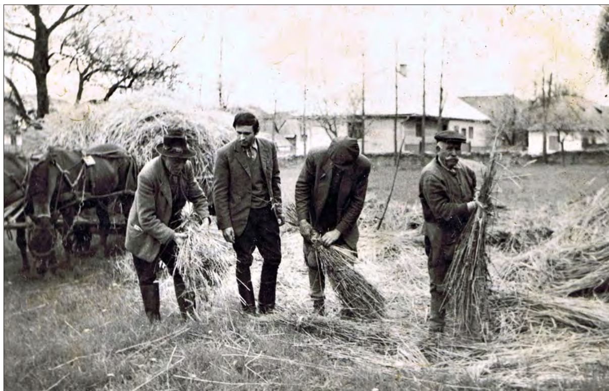
5. ábra Az Albisi ház zsuppozása 1974-ben