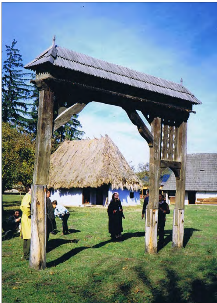
7. ábra 1974-ben már a második hagyományos kötött székelykapu is állt a skanzenben