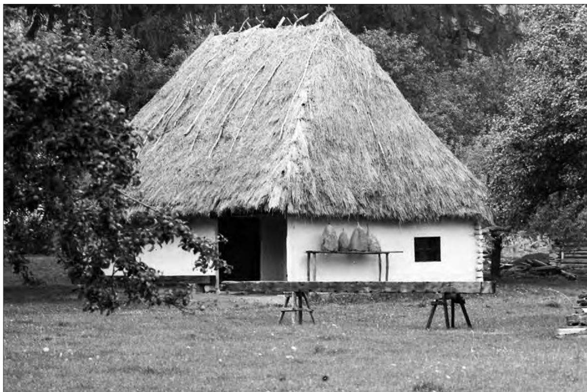
1. ábra Az Albisi székely házat 1974-ben telepítették át Csernátonba. Ez volt a szabadtéri részleg első építménye