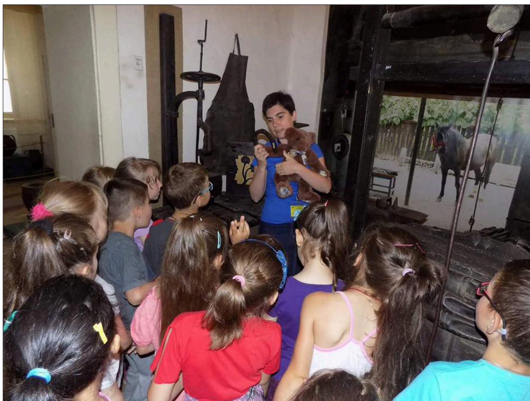
1. ábra Tárlatvezetés mackóval