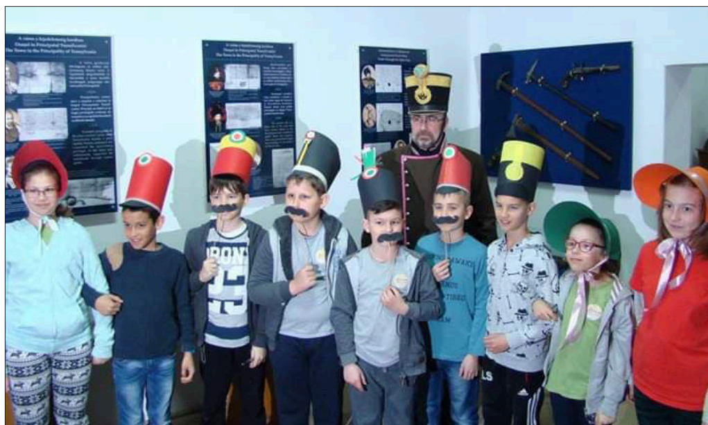
5. ábra Szerepjáték a történelmi kiállításon