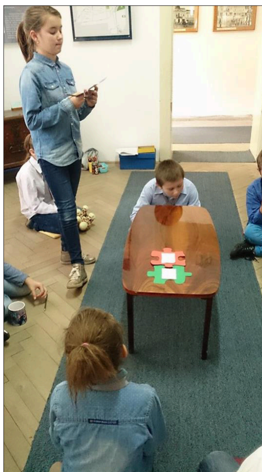
6. ábra Idővonal összeállítása a KézdivásárHelyünk a történelemben című foglalkozáson