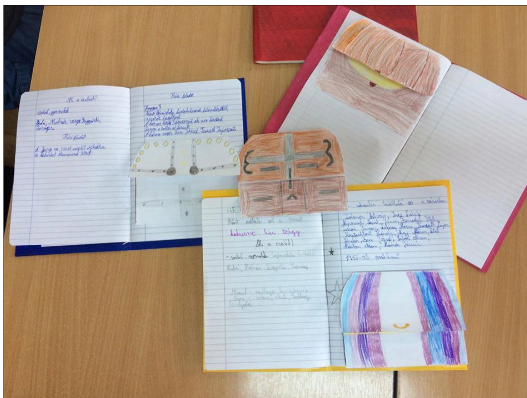
8. ábra Történelemfüzetek múzeumi kincsesládákkal