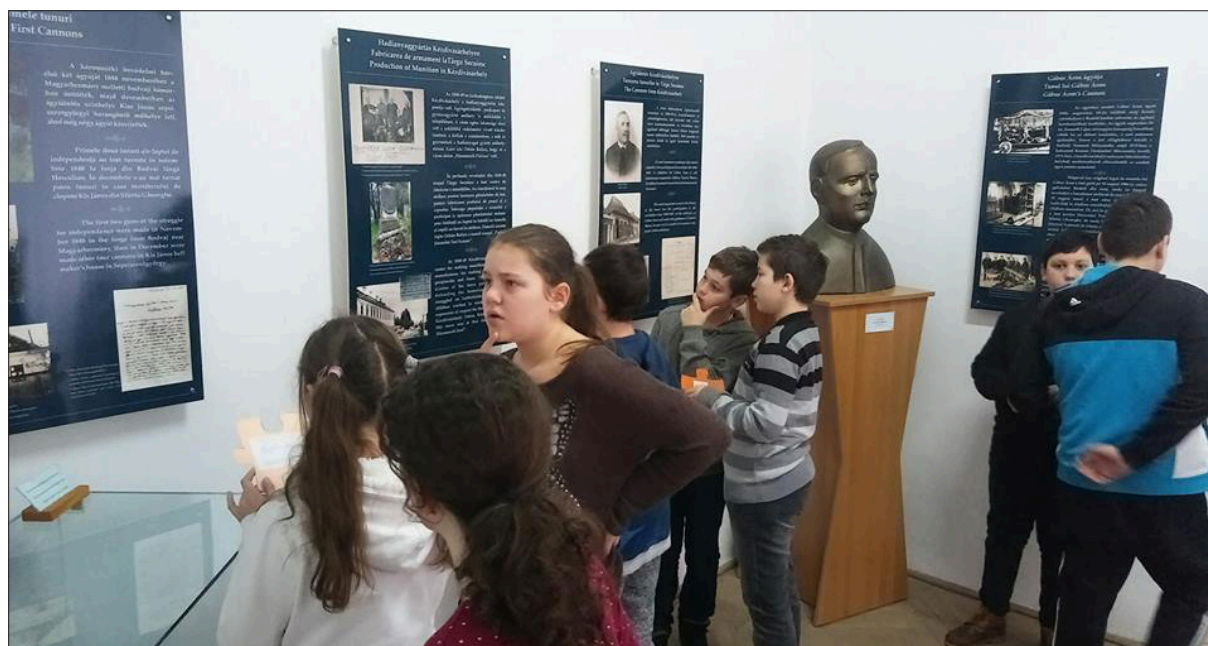
4. ábra Információgyűjtés