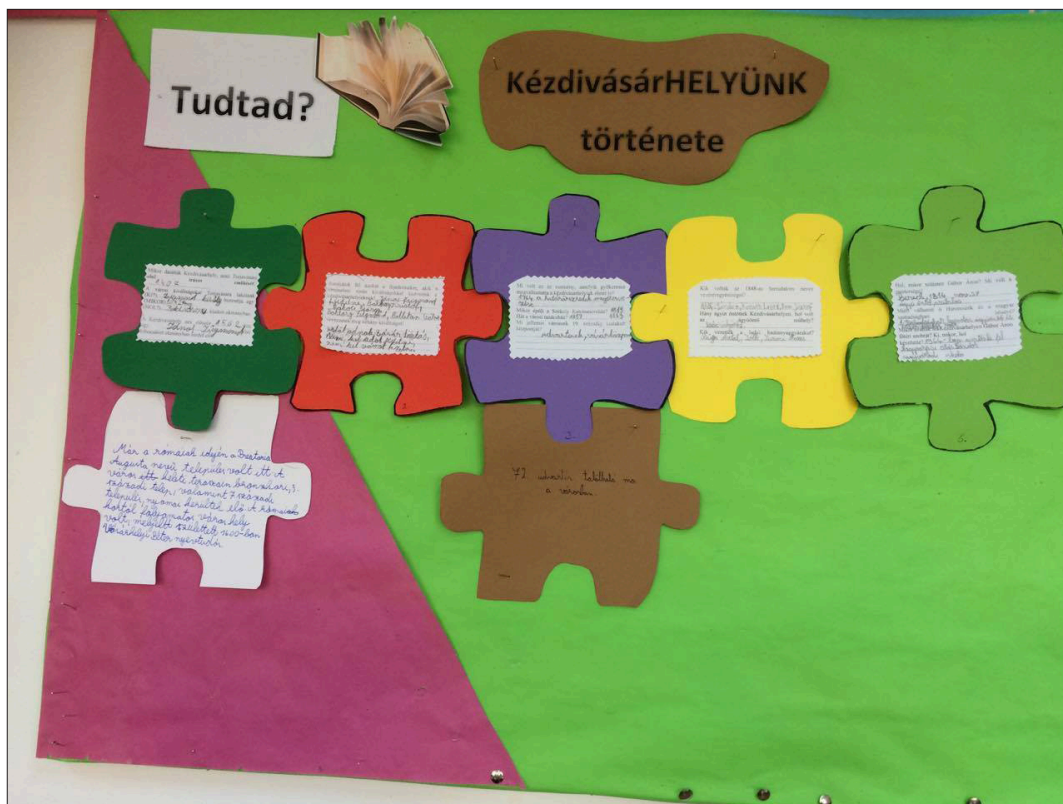
7. ábra Osztályban kiegészített idővonal